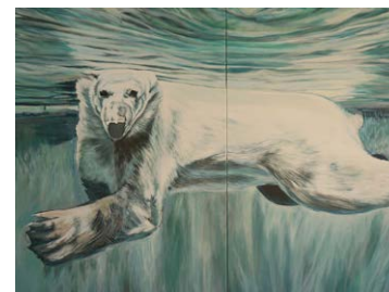
13 Angela Lackner | Mir träumte, ich ginge unter, 2019, Acryl auf Leinwand, 200 x 120 cm