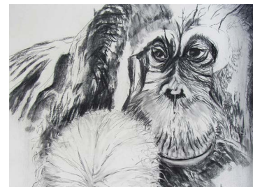
2 Thea Barth | Zwei Alte, 2015, Zeichnung: Bleistift, Graphit, Kohle auf Leinwand