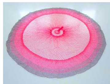
10 Gottlieb Hansen | Knallrotes Karotten-netz für die Nahrungsmittelmetamorphose, 2013, Installation, Durchmesser: 160 cm