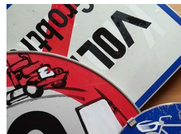
4 Peter Brandsma | Alles schläft, einsam wacht, 2019, Installation, 100 x 200 x 300 cm