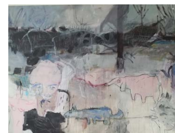
17 Sieglinde Rösch | Zeit die rosarote Brille abzulegen, 2019, Acryl, Tusche und Kreide auf Holzplatte, 150 x 260 cm

OFFENE ATELIERE Wer macht Kunst? Wo & Wie?