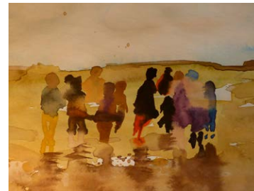
16 Hanni Mumelter | Die Wanderung, 2015, Aquarell, 50 x 50 cm