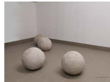
11 Anna-Maria Hörfarer | Grenzsteine, 2019, Installation