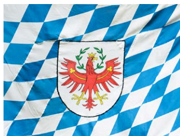
5 James Clay | Bayrol (Detail), 2014/19, Installation, 400 x 400 cm