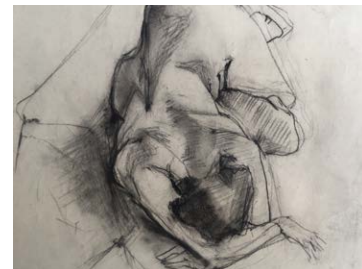
6 Luise Clay | Akt, 1948, Kohle, Bleistift auf Papier, 60 x 44 cm