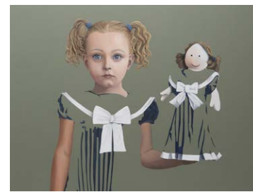
9 Nada Dietel | the difference, 2019, Acryl/Öl auf Leinwand, 140 x 110 cm