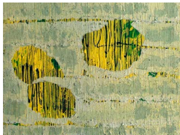
8 Leo de Romedis | Algenteppich 2-tlg., 2018, 200 x 75 cm