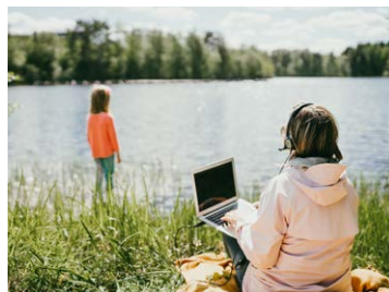
3 Christina Biasi | Allein, 2019, Fotografie, 75 x 50 cm